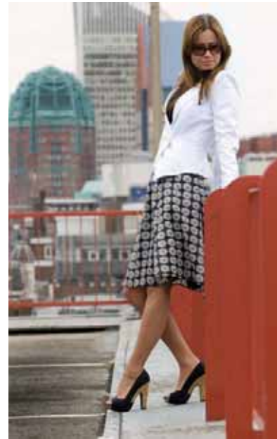
Rok van Paul Smith

Bijna alle producten zijn geproduceerd in Engeland en Italië, en Paul streeft erna uitsluitend stoffen en materialen te gebruiken die geproduceerd zijn in Engeland, Italië of Frankrijk. Als een tribute aan Paul Smith organiseert Boston Trader in samenwerking met Eye-D een modezondag die geheel in het teken staat van deze markante en sympathieke ontwerper. Zondag 25 mei wordt een feestje in de Prinsestraat. De muziek wordt de hele dag verzorgd door een DJ, de kurken zullen knallen van de champagne en de prosecco. Met een beetje geluk kunt u borrelen en netwerken in de zon voor de deur.